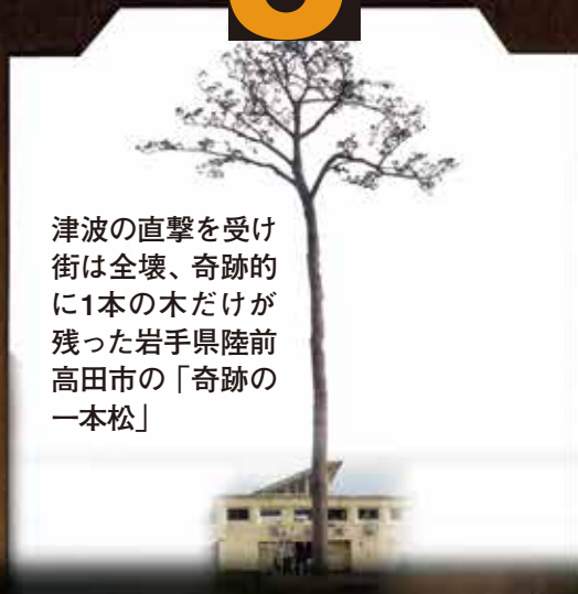
津波の直撃を受け街は全壊、奇跡的に1本の木だけが残った岩手県陸前高田市の「奇跡の一本松」