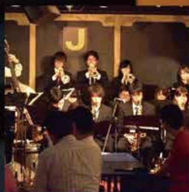
早稲田大学ハイ・ソサエティ・ オーケストラ