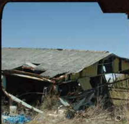
津波で全壊した民家。福島県楢葉町。帰還が始まったばかりだが！