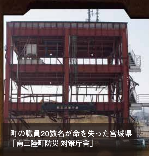
町の職員20数名が命を失った宮城県 「南三陸町防災 対策庁舎」