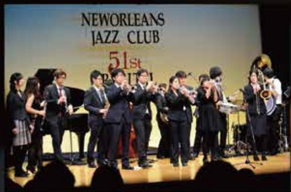
早稲田大学ニューオルリンズジャズクラブ