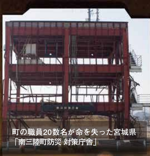
町の職員20数名が命を失った宮城県「南三陸町防災 対策庁舎」