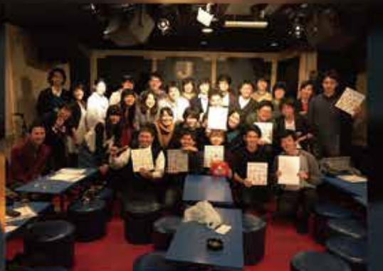
早稲田大学モダンジャズ研究会