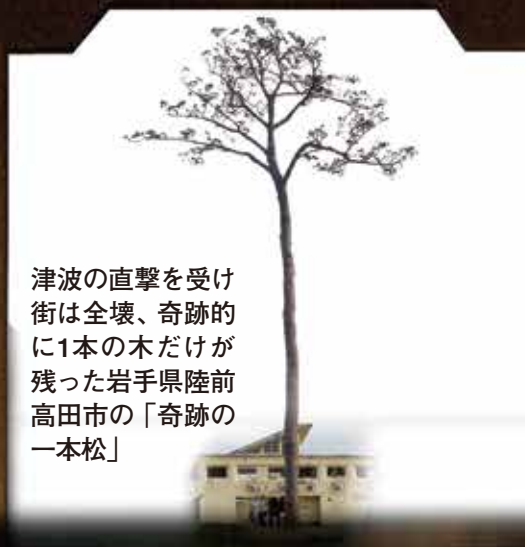
津波の直撃を受け 街は全壊、奇跡的 に1本の木だけが 残った岩手県陸前 高田市の「奇跡の 一本松」