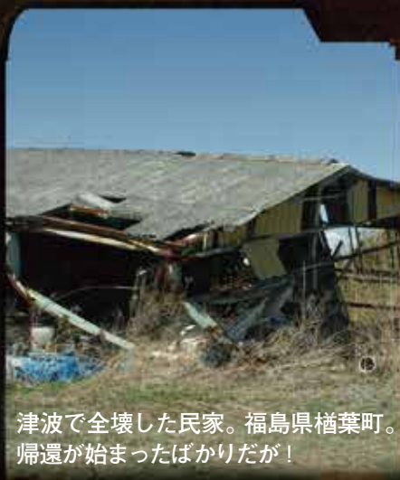
津波で全壊した民家。福島県楢葉町。 帰還が始まったばかりだが！